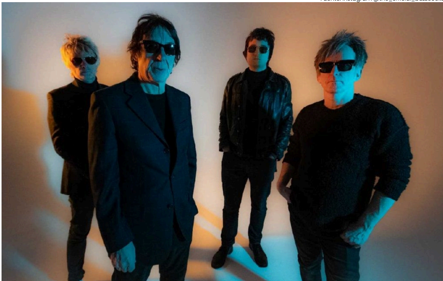
Buzzcocks llega por primera vez a Lima este 31 de mayo, con un show íntimo en Yield Rock que promete repasar lo mejor de su legado punk.