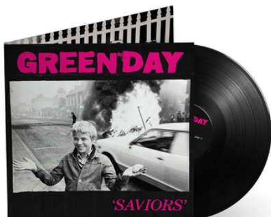
Portada del álbum Saviors (2024), el más reciente lanzamiento de la banda californiana.

« Saviors », el nuevo álbum de Green Day, refleja más de 30 años de carrera con frescura. Con 15 temas que exploran emociones, protestas y energía punk, ha sido bien recibido por críticos y público.